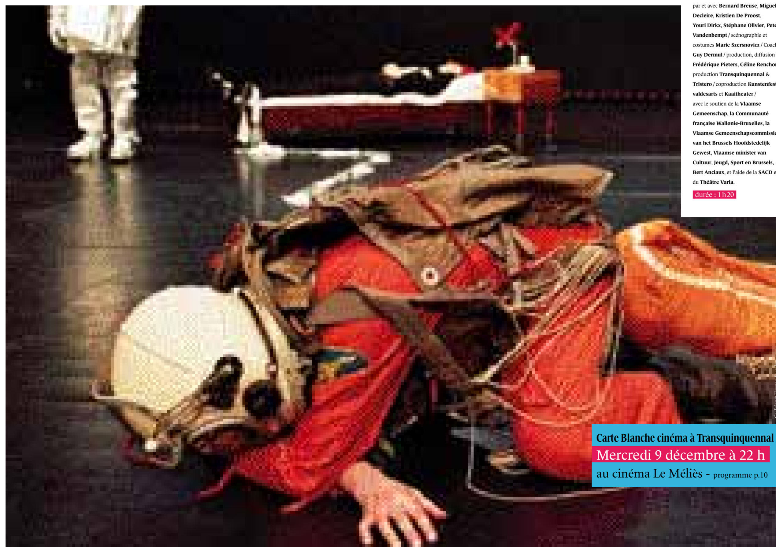
Coalition © Herman Snyders

O n démarre ce spectacle – succès du dernier Kunstenfestivaldesarts – comme on attacherait sa ceinture dans un avion : pas forcément tranquille, un brin nerveux. Et on a raison : une actrice nous met tout de suite dans le bain en nous indiquant les issues de secours, puis, on nous signale que le « festival et les deux compagnies ne peuvent pas être tenus responsables de ce qui pourrait arriver ». Place donc à l'imprévu ! Et c'est parti pour l'évocation des accidents les plus divers. Des petites frayeurs aux grosses catastrophes, tout y passe : crash aérien historique, blessures au genou, le tout accompagné de statistiques, dont une savoureuse : « Il y a 0,0001% de chance de mourir dans un spectacle. » Car le risque est bien au cœur de ce spectacle, ou plutôt, notre obsession contemporaine à le neutraliser, à inventer des « principes de précaution », une « gestion du risque » et autre « continuité d'activité ». On ira de surprise en surprise et bien sûr, on se reconnaîtra au détour d'un personnage. Ce spectacle brillant et drôle est nommé pour le Prix de la Critique dans la catégorie « Meilleur spectacle de l'année 2009 ».