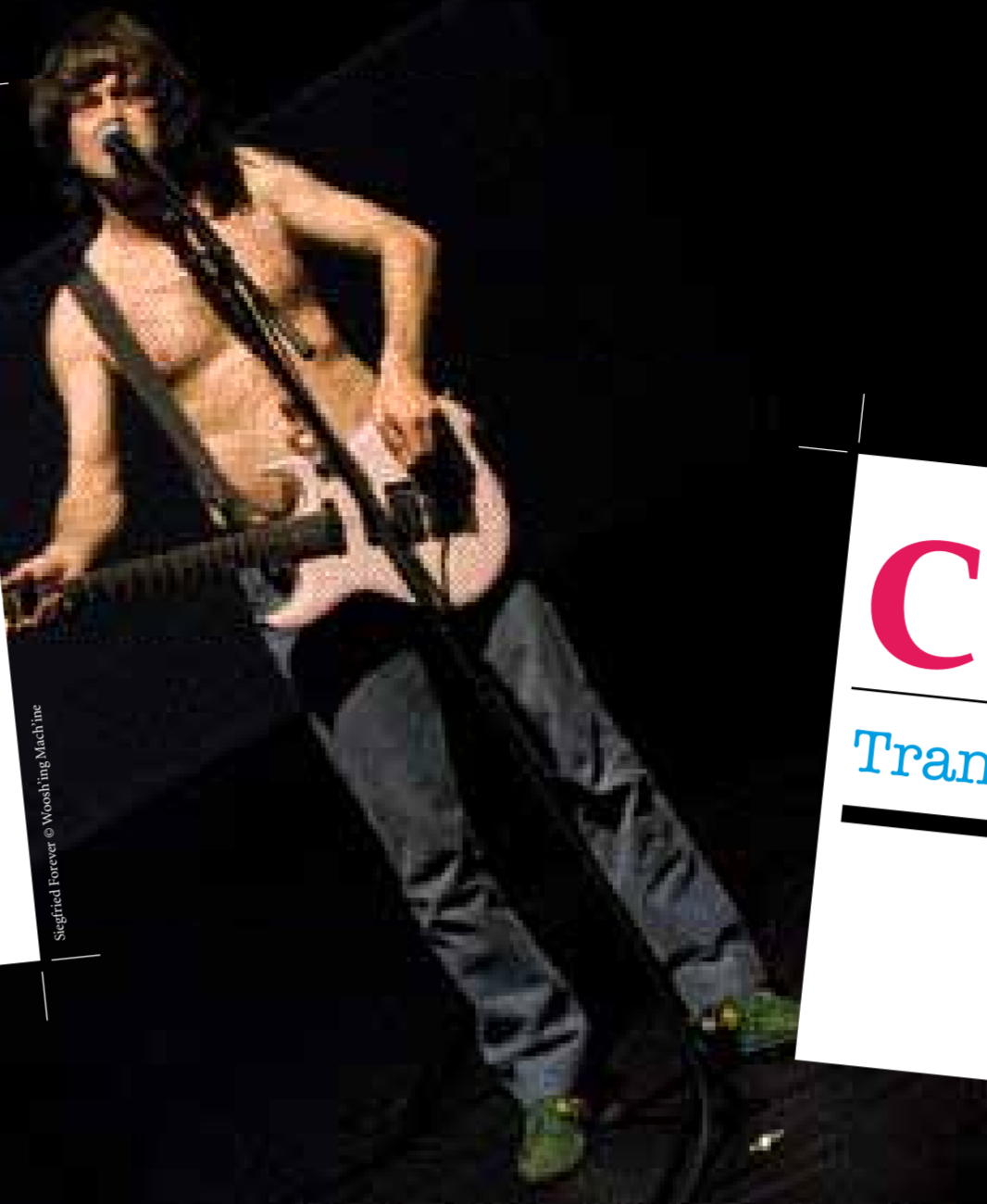
Siegfried Forever © Woosh'ing Mach'ine

à La Comédie de Saint-Étienne / Théâtre Jean Dasté