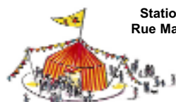
ESPACE CIRQUE D'ANTONY