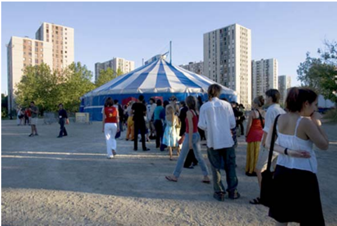
Espace Cirque d'Antony

Directeur du Théâtre Firmin Gémier d'Antony – scène conventionnée d'Antony