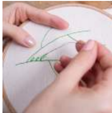
Tambour à broder