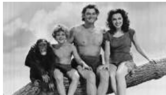
Affiche du film de 1943 et photo extraite du film.