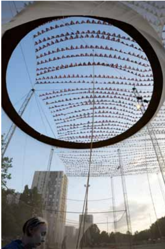
Djama BurenCirque