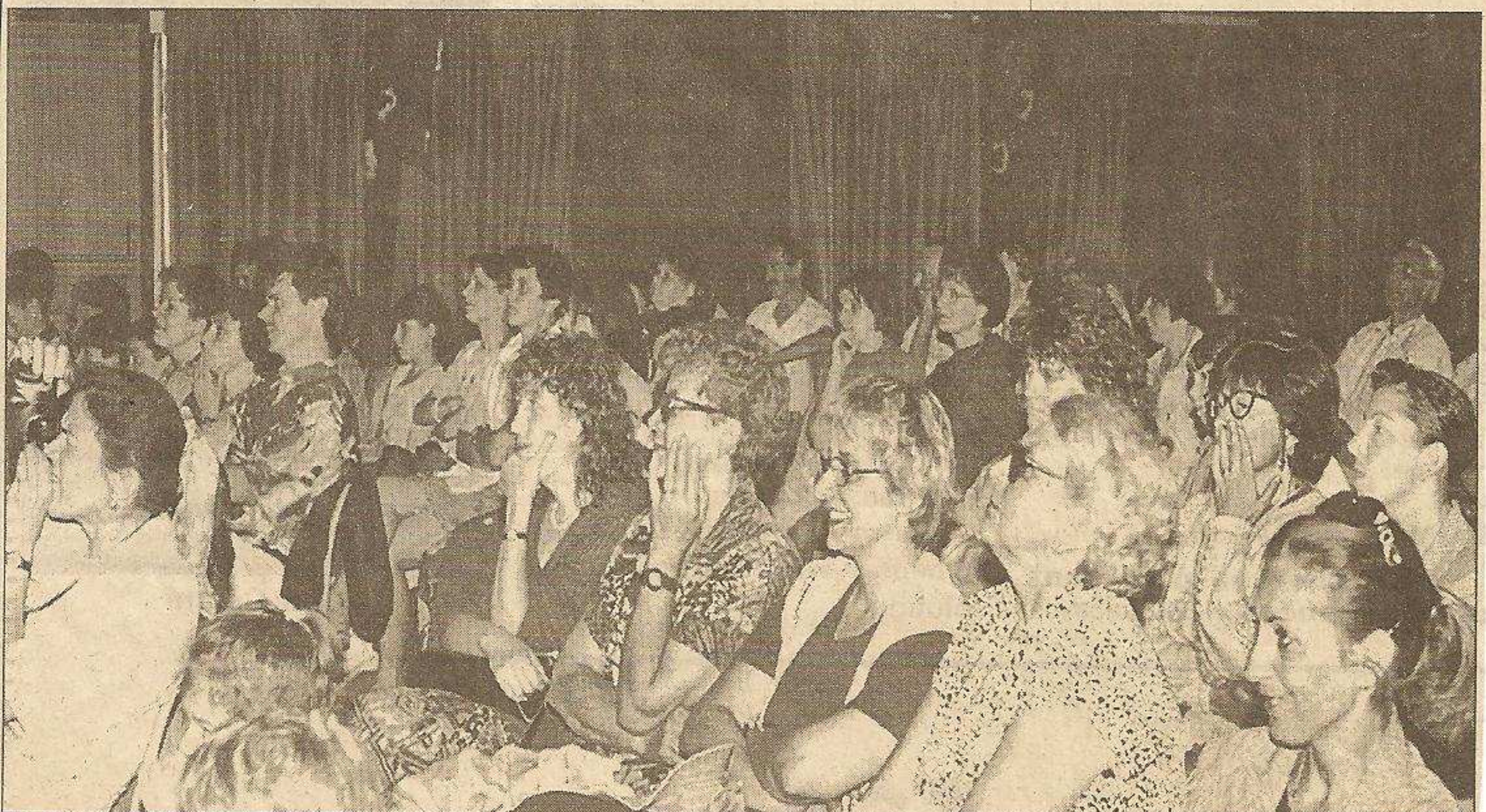
Un public enchanté