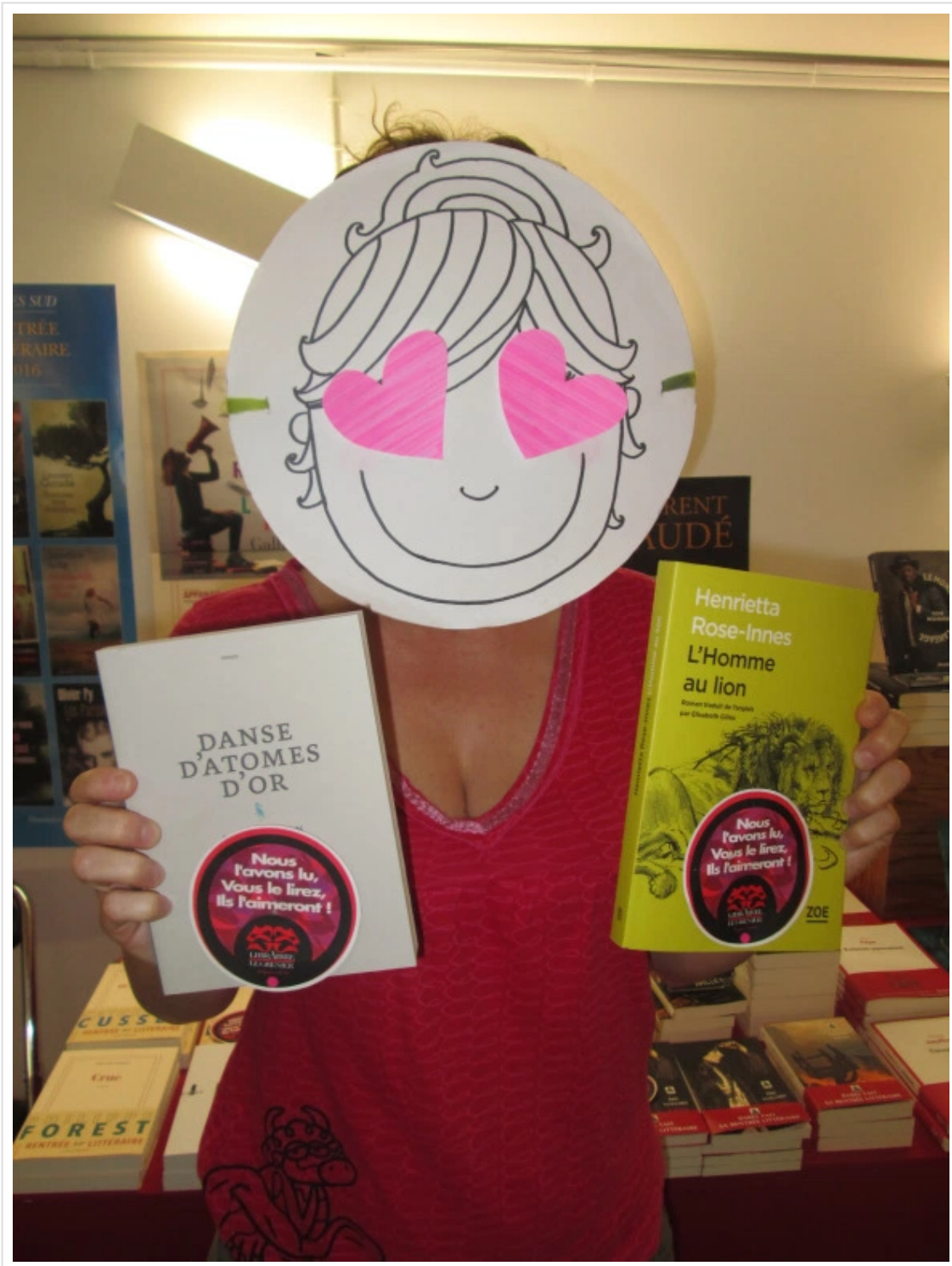
Danse d'atomes d'or