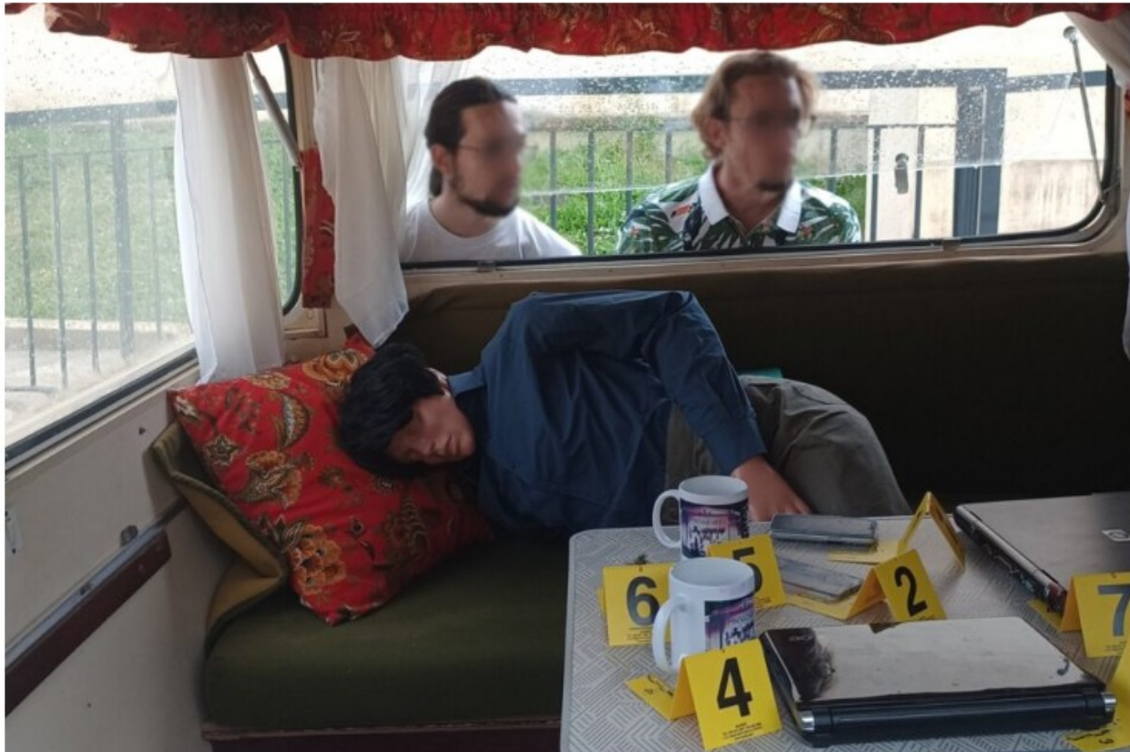
Une Murder Party Mobile arrive dans les départements du Gers, de la Haute-Garonne et de l'Aveyron pour l'été 2023.