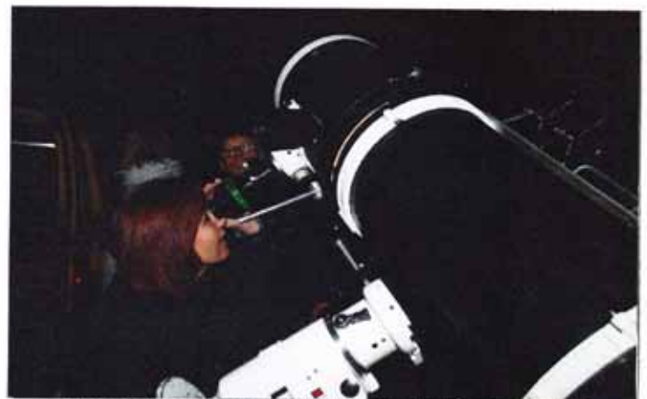
D'abord menaçant, le ciel s'est ouvert pour permettre au public d'observer les étoiles.

Vers 21 h, le groupe de musiciens a continué à jouer pour l'ambiance, tandis qu'une rapide conférence sur les observations stellaires fut