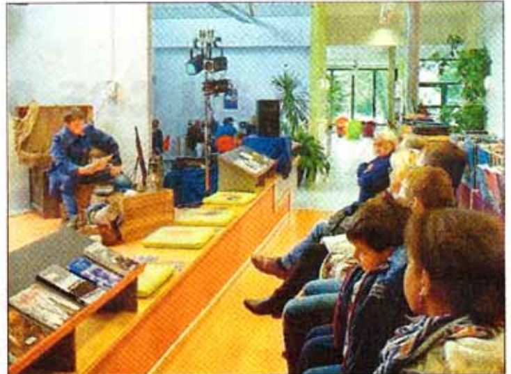
Lecture de vraies correspondances devant un public muet d'émotion.

Ces lettres sont assés, pleines de toute leur